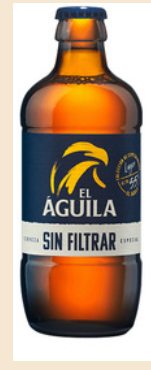
EL ÁGUILA SIN FILTRAR